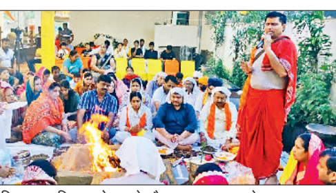
घरौंडा। आयोजित प्राण प्रतिष्ठा महोत्सव के दौरान हवन यज्ञ करते श्रद्धालु।

निस्वार्थ समाज सेवा समिति के तत्वावधान में आयोजित हुआ धार्मिक आयोजन