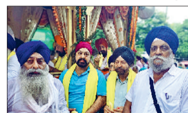
नगर कीर्तन में मौजूद सिख धर्म के अनुयायी।

गुरु ग्रंथ साहेब के प्रकाश पर्व पर करनाल शहर में धार्मिक आस्था और श्रद्धा का अद्भुत संगम देखने को मिला। गुरुद्वारा सिंह सभा, मॉडल टाउन से भव्य नगरकीर्तन निकाला गया,