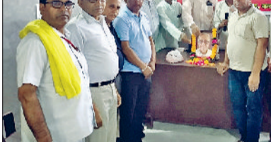
करनाल। सीपीआई हरियाणा राज्य कार्यकारिणी की बैठक में मौजूद कार्यकर्ता।