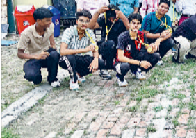
करनाल। यूको बैंक स्टाफ के साथ विजेता टीम।