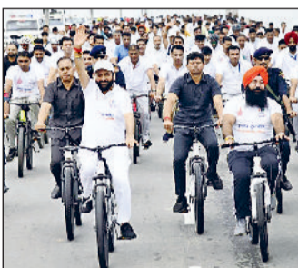
हरिभूमि न्यूज | कुरुक्षेत्र

मुख्यमंत्री नायब सिंह सैनी ने युवाओं से आह्वान किया कि वे खेल को अपने जीवन का अभिन्न अंग बनाएं और हॉकी के जादूगर मेजर ध्यानचंद की तरह अनुशासन, मेहनत और समर्पण के मार्ग पर चलें। उन्होंने वर्ष 2036 के ओलम्पिक खेलों में हरियाणा के खिलाड़ियों द्वारा सबसे अधिक मेडल जीतने के लिए प्रेरित भी किया। मुख्यमंत्री नायब सिंह सैनी रविवार को ब्रह्मसरोवर पर हरियाणा खेल विभाग की तरफ से हॉकी के जादूगर मेजर ध्यानचंद की जयंती के उपलक्ष्य में आयोजित तीन दिवसीय कार्यक्रमों के समापन अवसर पर आयोजित साइक्लोलॉन कार्यक्रम में युवाओं को सम्बोधित कर रहे थे। इससे पहले, मुख्यमंत्री नायब सिंह सैनी ने श्रमदान करके स्वच्छ कुरुक्षेत्र, मेरा कुरुक्षेत्र, मेरा अभिमान का शुभारम्भ किया। हरियाणा के खेल विभाग द्वारा आयोजित इस कार्यक्रम में साइक्लाथोन और स्वच्छता को जोड़कर युवाओं को स्वच्छ और स्वस्थ रहने के लिए प्रेरित किया गया।