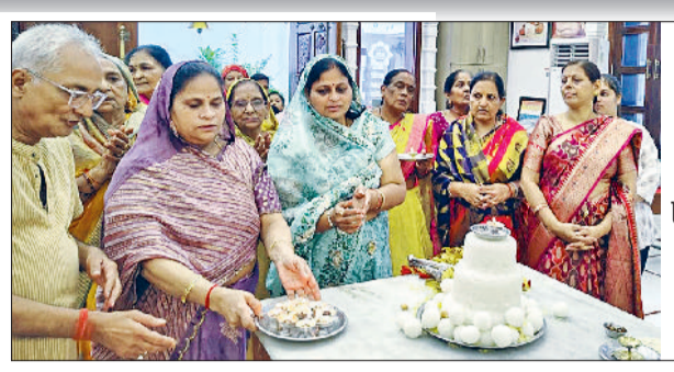
पानीपत। श्री दिगंबर जैन बड़ा मंदिर में पूजन करते हुए जैन श्रद्धालुगण।

श्री दिगंबर जैन बड़ा मंदिर, जैन मोहल्ला में जैन धर्म के सबसे पवित्र दसलक्षण पर्व का चौथा दिन रविवार को व तीर्थंकर श्री पुष्पदंत भगवान का निर्वाण कल्याणक बहुत ही श्रद्धा के साथ मनाया। वहीं, रविवार को पर्व के चौथे दिवस को उत्तम शौच धर्म के रूप में मनाया गया। इस अवसर पर मंदिर में कल्याण मंदिर विधान का भव्य आयोजन हुआ साथ ही शहर के सभी सातों दिगंबर जैन मंदिरों में विशेष रूप से भगवान पुष्पदंत मोक्ष कल्याणक के पावन उपलक्ष्य में निर्वाण लाडू समर्पित किए गए। सर्वप्रथम श्रीजी का अभिषेक एवं शांति धारा संपन्न हुआ। इसके पश्चात नित्य