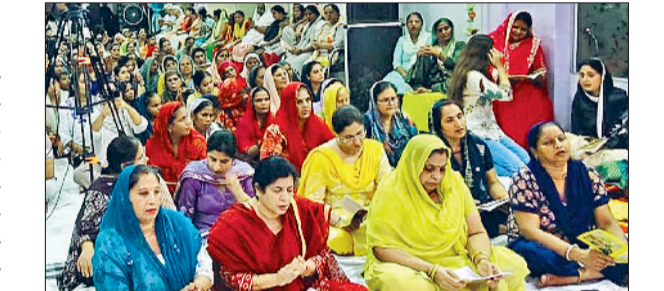
पानीपत। श्री अवध धाम मंदिर में सत्संग का श्रवण करते हुए श्रद्धालुगण।