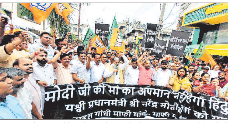
अंबाला। सड़कों पर रोष मार्च निकालते भाजपा नेता व कार्यकर्ता।