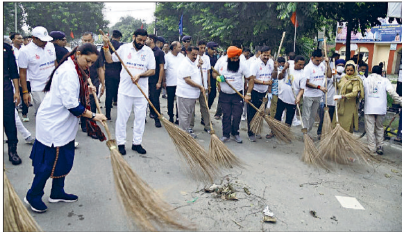
कुरुक्षेत्र। सफाई अभियान का शुभारंभ करते मुख्यमंत्री नायब सिंह सैनी।

सीएम ने युवाओं को नशा से दूर रहने के लिए प्रेरित करते हुए कहा कि नशा ऐसी बुराई है, जो व्यक्ति को ही नहीं, पूरे परिवार-समाज को खोखला कर देती है। यह न केवल शारीरिक और मानसिक स्वास्थ्य को प्रभावित करता है, बल्कि सामाजिक ताने-बाने को भी कमजोर करता है।