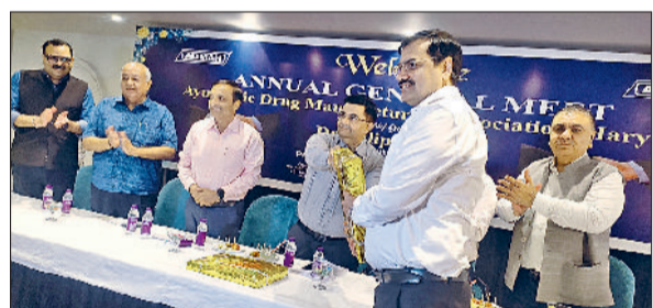
करनाल। आयुर्वेदिक ड्रग मैनुफैक्चर्स एसोसिएशन की बैठक में मौजूद पदाधिकारी।

देशों में आयुर्वेदिक उत्पाद भेज रहा है। मिश्रा ने कहा कि प्रधानमंत्री के आत्मनिर्भर भारत और विश्वगुरु के सपने को साकार करने में आयुर्वेदिक सेक्टर की अहम भूमिका होगी। उन्होंने कहा कि पांच