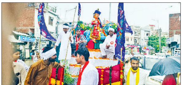
घरौंडा। जाहरवीर गोगा जी महाराज के उत्सव पर शोभायात्रा निकालते भक्त।

सेक्टर-8 स्थित श्रीराम मंदिर में निस्वार्थ समाज सेवा समिति के तत्वावधान में आयोजित हुआ धार्मिक आयोजन