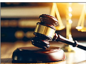
करनाल