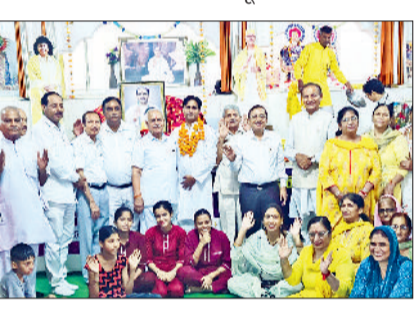
पानीपत। श्री सोम नाथ धाम आश्रम, निबरी में श्री राधा अष्टमी का उत्सव मनाते हुए श्रद्धालुगण।